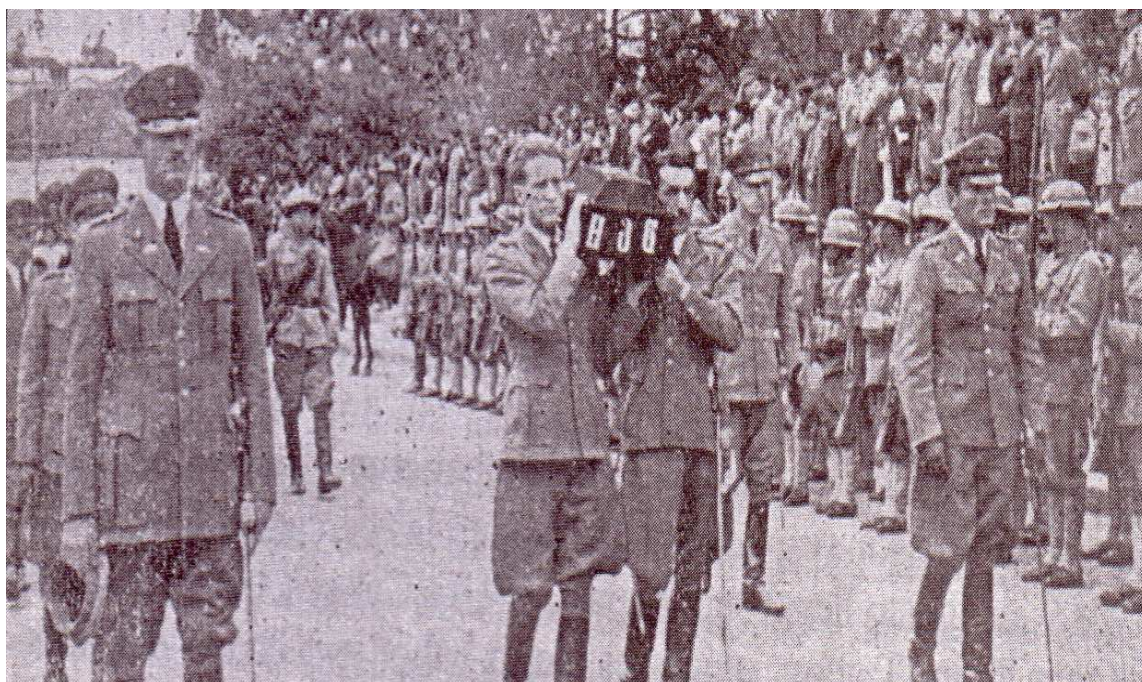
TRASLADO DE LOS RESTOS DEL TNTE. HUGO ORTIZ.

En el escenario amazónico, el 1 de agosto de 1941, una fuerza compuesta de 300 peruanos atraviesa el río Yaupi, aniquila el puesto militar y sitúa el destacamento de Santiago compuesta de 10 hombres al mando del Sub Teniente Hugo Ortiz Garcés quien al no rendirse ante la insinuación hecha por el comandante peruano murió como héroe.